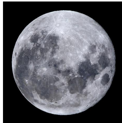
▲天体望遠鏡で見る中秋の名月 (イメージ)