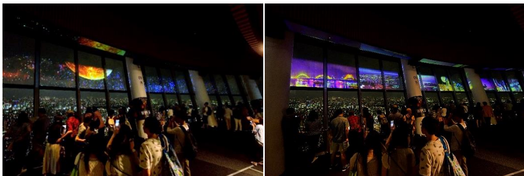
▲SKYTREE ROUND THEATER® で上映した過去の秋プログラム (イメージ)

東京スカイツリー天望デッキフロア350の窓ガラス (横幅約110メートル、高さ約2メートル) を巨大スクリーンに仕立て、夜景を眺めながら迫力ある映像と臨場感溢れる音響を楽しめる「SKYTREE ROUND THEATER®」では、秋の新プログラムを上映します。日本特有の文化でもあるお月見をテーマに、時間と場所を超えた様々な日本の名所で中秋の名月を楽しむことができるスペシャルコンテンツです。