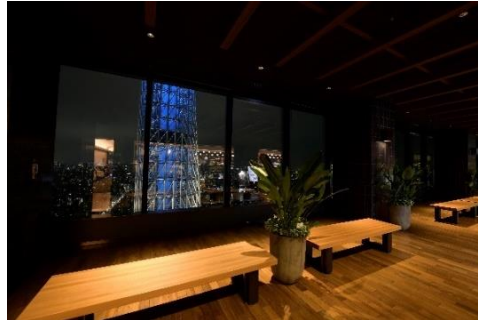
▲ミニ JAZZ ライブ実施場所 (イメージ)