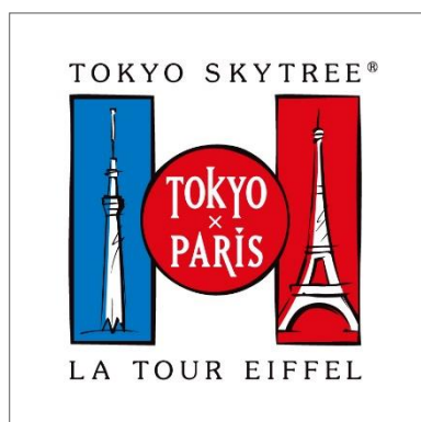
△コラボレーションロゴ