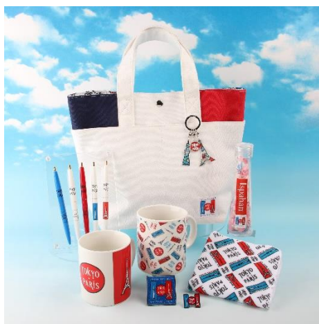
△コラボレーションロゴを使用した商品（イメージ）