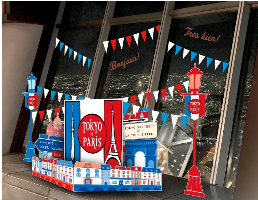
△フォトスポット (イメージ)