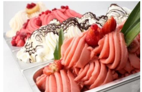
▲昨年のアイスクリーム総選挙で 1位に輝いたCAMPO SOLARE