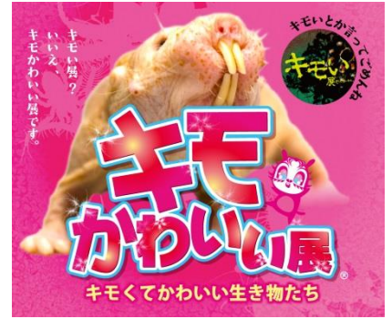
▲キモかわいい展。(イメージ)

期 間 6月7日(木)～7月8日(日) 時 間 10:00～20:00 (※最終入場は19:30) 場 所 東京ソラマチ イーストヤード5階 スペース634 料 金 未 定