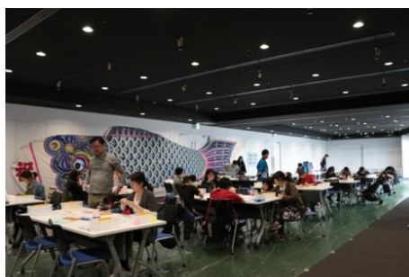
▲こいのぼりワークショップ(過去の様子)