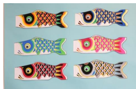
▲手書きこいのぼり作品例