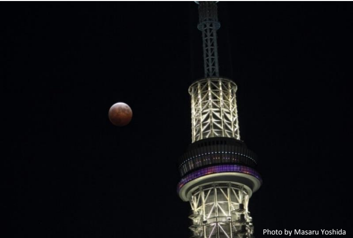
東京スカイツリーと赤銅色の皆既月食(イメージ)

今回のように、「皆既月食」と「ブルームーン」が重なるのはとても稀です。ぜひ、この機会に東京スカイツリータウンから見られる貴重な天体ショーを存分にお楽しみください。