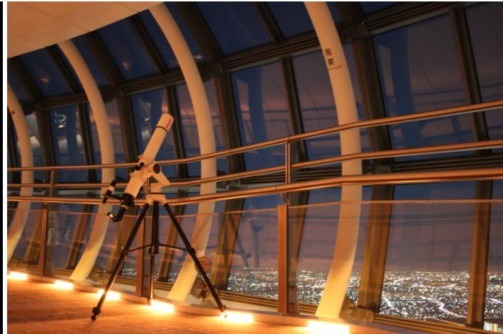
天望回廊における天体観測(イメージ)