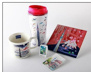
△オリジナルグッズ例