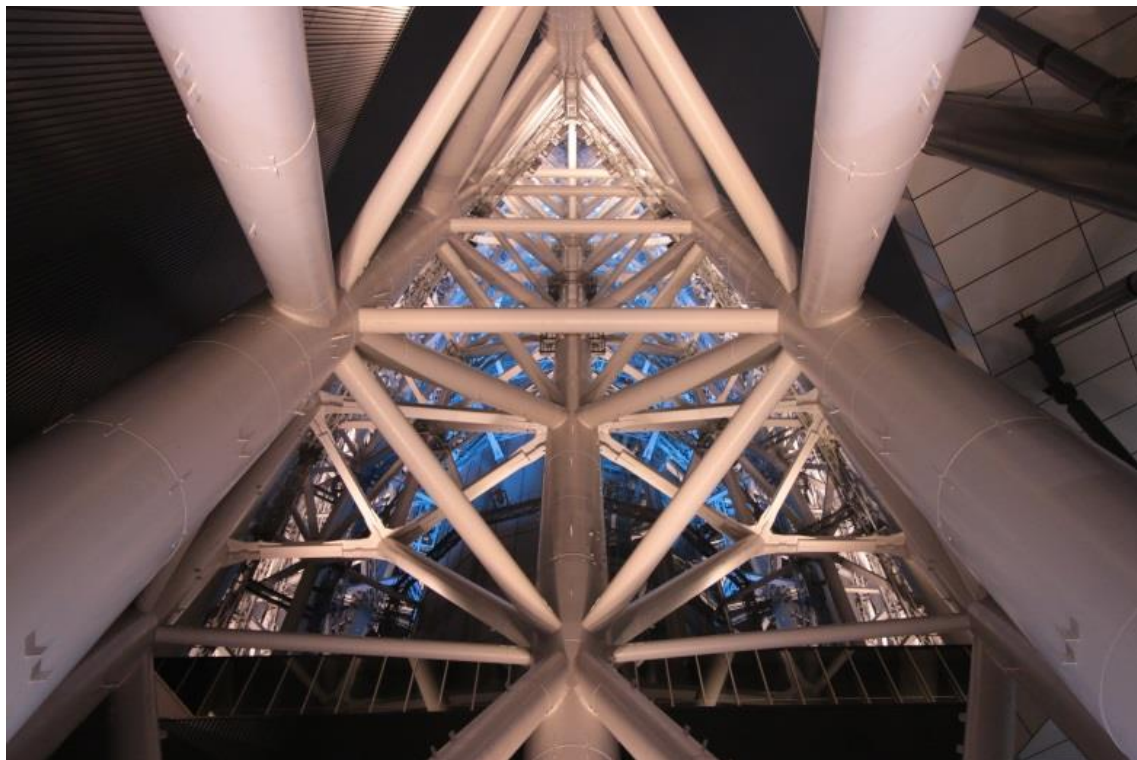
▲東京スカイツリー®構造ガイドツアー 鼎から見上げる通常ライティング「粋」の様子