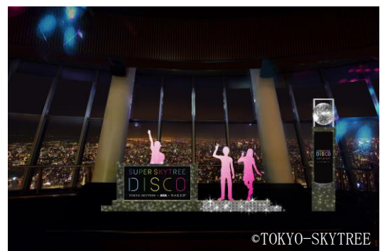
▲フオトスポット (イメージ)