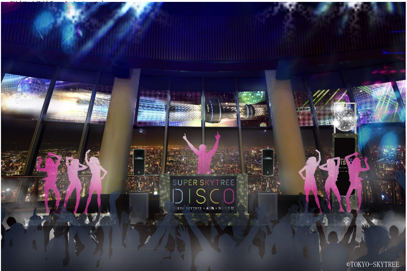
▲SUPER SKYTREE® DISCO DJ イベントの様子（イメージ）

特に期間中の毎週金曜日は、80年代のディスコ全盛時代の象徴ともいえるレジェンドDJをはじめ現在も第一線で活躍するトップDJや人気DJをキャスティングし、天望デッキで東京スカイツリーならではの特別なDJイベントを幅広い年代の方々にお楽しみいただけます。