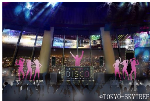
▲DJイベントの様子（イメージ）

※予告なく変更または、中止になる場合があります。 ※混雑状況により、展望台への入場を制限する場合があります。