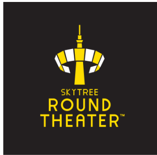
◀ SKYTREE ROUND THEATER® ロゴマーク

夜間の天望デッキ フロア350において、窓ガラスの360°のうち255°、横幅約110メートル、高さ約2メートルを巨大スクリーンに仕立て、展望台から見える夜景を背景に、18台のスピーカーによる臨場感溢れる音響とともに34台のプロジェクターで迫力のある映像を投影するプロジェクションマッピングを利用したショーです。