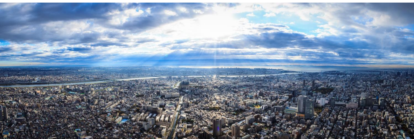
△展望台からの眺望（イメージ）