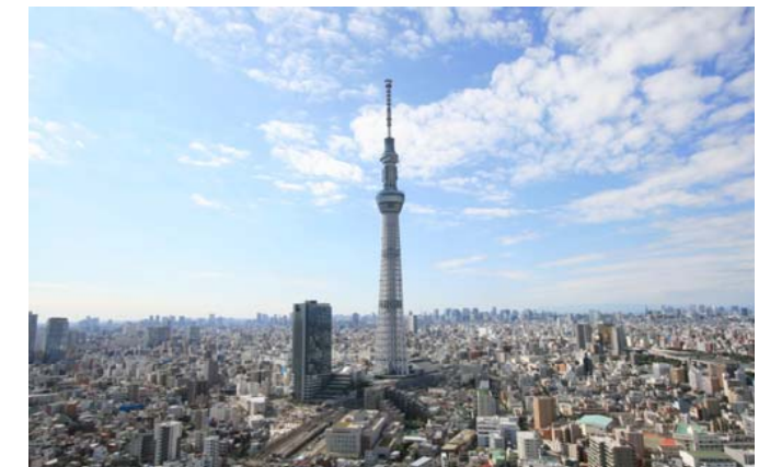
定点写真 平成23年10月26日 撮影