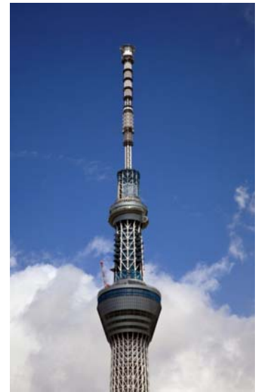
航空写真 平成23年8月10日 撮影