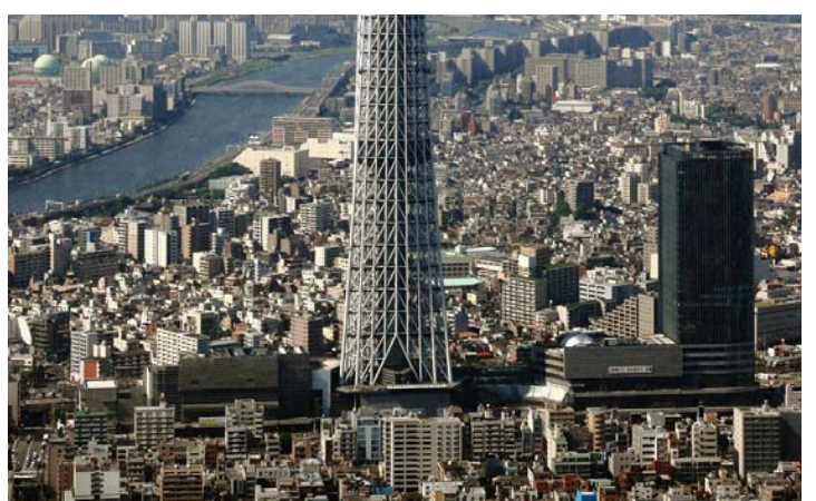
航空写真 平成23年8月10日 撮影

(本計画に関する全てのご相談窓口) 電話: 03-5610-0605 月~土 8時~20時 (工事に関するご相談窓口) 電話: 03-3829-6310 月~土及び祝日 8時~20時 (緊急の場合は、上記以外も連絡可能)