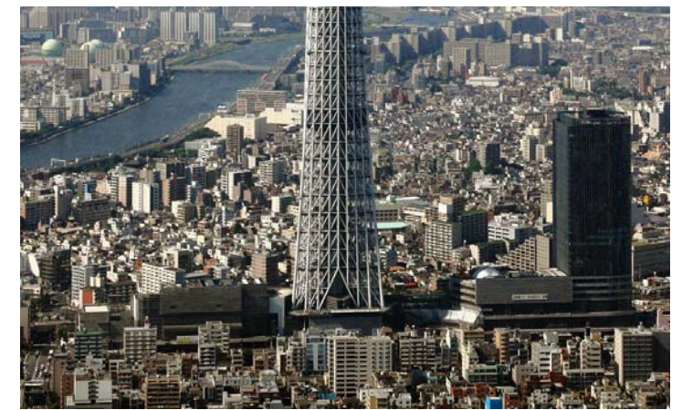
航空写真 平成23年8月10日 撮影

(本計画に関する全てのご相談窓口) 電話: 03-5610-0605 月~土 8時~20時 (工事に関するご相談窓口) 電話: 03-3829-6310 月~土及び祝日 8時~20時 (緊急の場合は、上記以外も連絡可能)