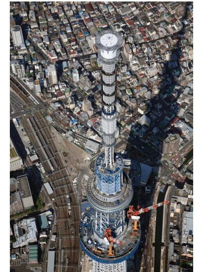
航空写真 平成23年6月21日 撮影