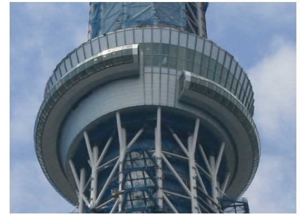
第2展望台空中回廊外装状況

(本計画に関する全てのご相談窓口) 電話：03-5610-0605 月~土 8時~20時 (工事に関するご相談窓口) 電話：03-3829-6310 月~土及び祝日 8時~20時 (緊急の場合は、上記以外も連絡可能)