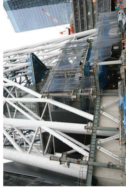
低層棟南側鉄骨建方及び外装工事施工状況