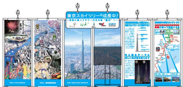
【駅コンコースに設置するブース】